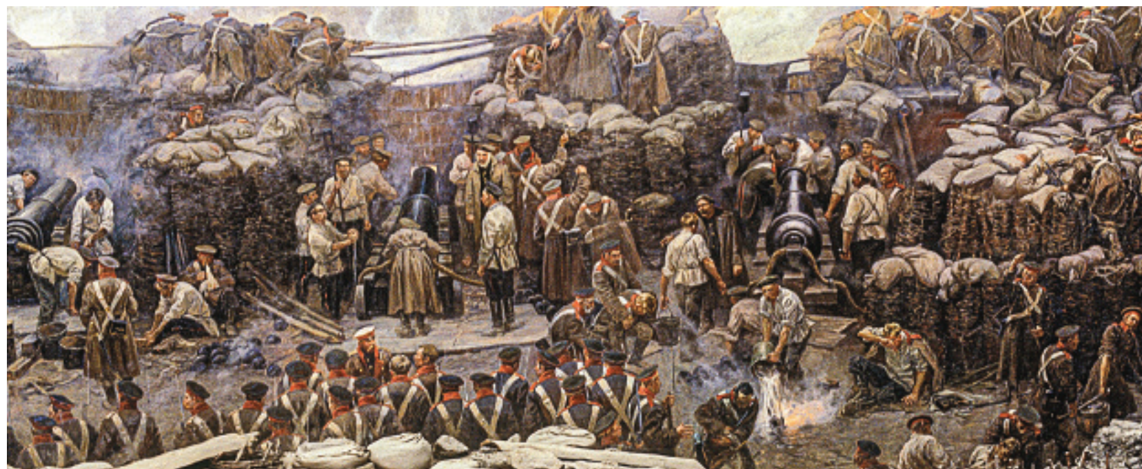
Фрагменты панорамы «Оборона Севастополя 1854–1855 гг.», Автор Ф. Рубо / АЛЕКСАНДР ЛЫСКИН / © РИА «НОВОСТИ»

языки, а после двух курсов перешёл на юридический. Потом перебрался в Санкт-Петербург и пытался там продолжить обучение. Но что-то постоянно мешало сдать экзамены: то не явился, то прогулял, то заболел, то недоучил.