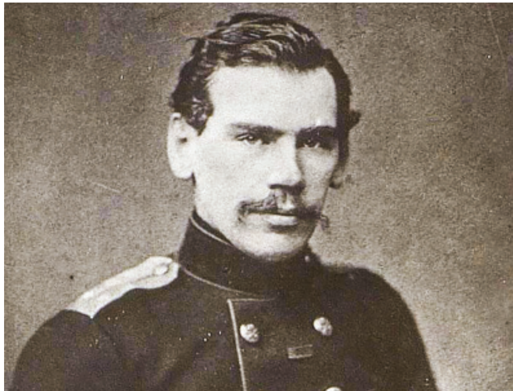
Лев Толстой, Санкт-Петербург, 1856 год.